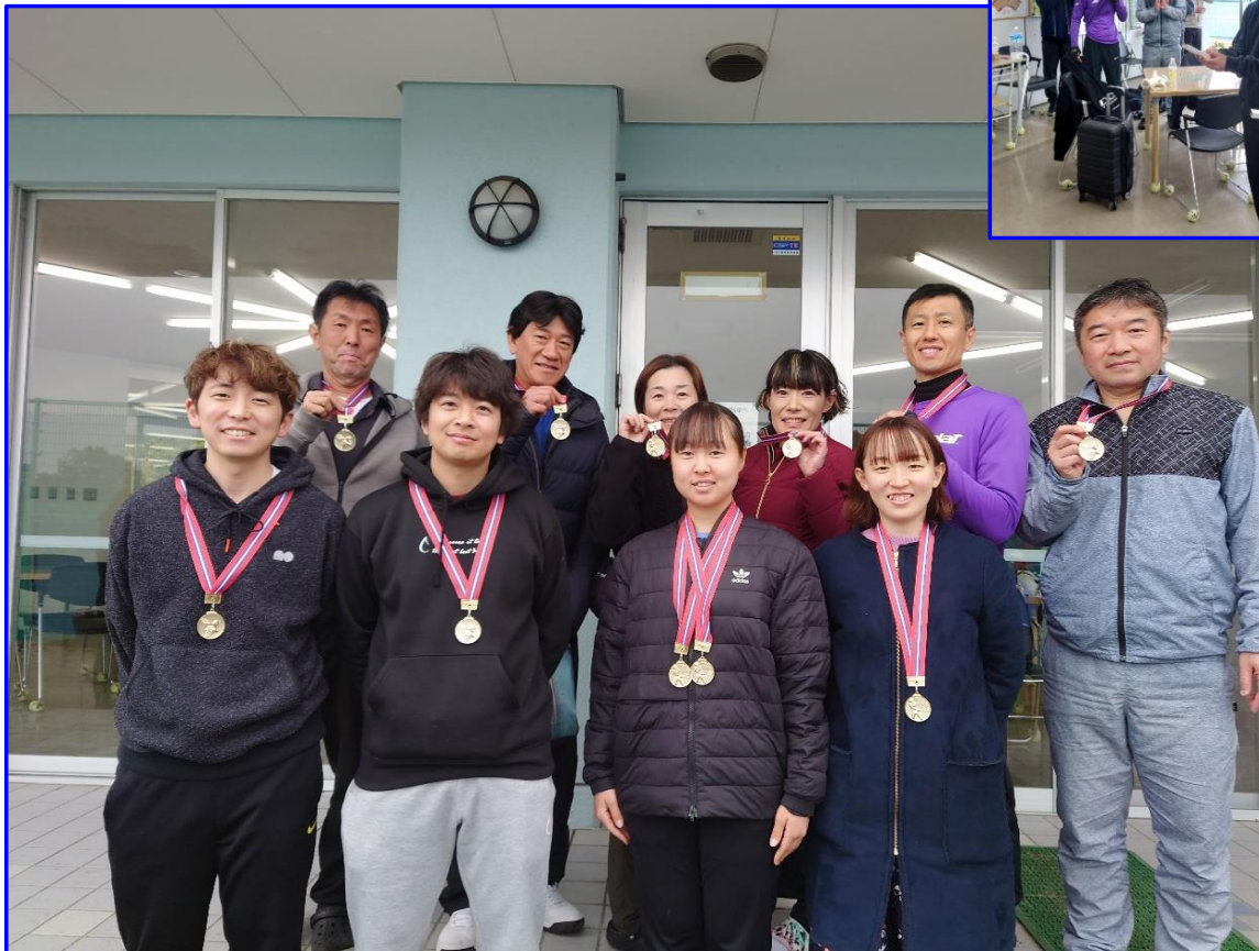
各種目 ダブルス優勝者 2024.3.20 七北田コート